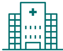
Freie Wahl des Krankenhauses