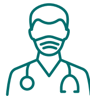
Freie Arztwahl in Privatklinik